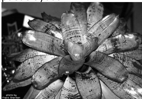
Bromelia de tanque

Que hacer: Lo mejor es eliminar las bromelias de su patio. Lavar las plantas frecuentemente con una manguera para enjuagar las larvas puede ayudar.