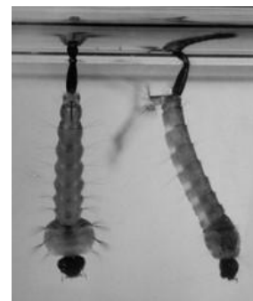
Larvas de mosquito

Si tiene problemas con, o preguntas sobre los mosquitos llame al Distrito de Control de Mosquitos de Indian River al número 772-562-2393 o visite nuestra página web en: www.irmosquito.com .