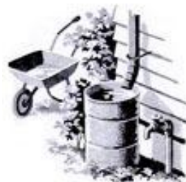
Recipientes que acumulan agua

2. Mosquitos de plantas que acumulan agua ( Wyeomyia sp. )- se desarrollan en plantas llamadas "bromelias de tanque" en las cuales cada hoja funciona como un recipiente que acumula agua.